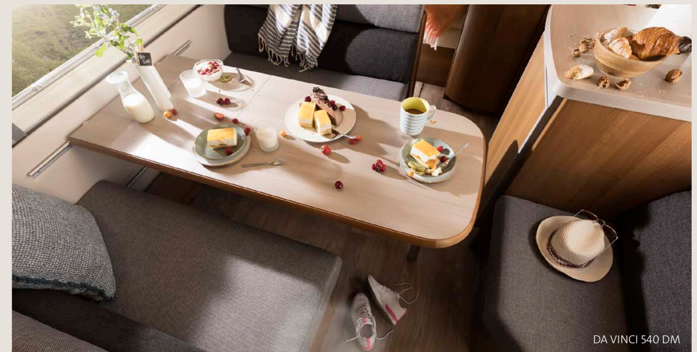
DA VINCI 540 DM

MEHR Raumgefühl: Das attraktive „Noce Opera Caramel“-Dekor mit den weißen Applikationen in Lederhaptik auf den Oberschränken leitet das Auge von der hochwertig gepolsterten Rundsitzgruppe bis in den Schlafbereich.