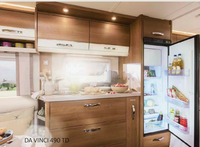
DA VINCI 490 TD

MEHR Platz: Die ausgekochte DA VINCI Küche überzeugt mit geräumigen Schubladen und großem Kühlschrank.