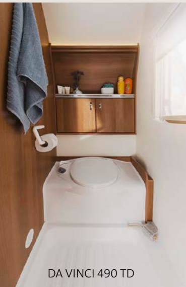
DA VINCI 490 TD

Wer schon immer mit einem TABBERT geliebäugelt hat, für den ist die Gelegenheit günstig, sich diesen Traum zu erfüllen. Den beliebten DA VINCI gibt es jetzt als FINEST EDITION in 11 Grundrissvarianten für Familien und Paare. Der ohnehin schon üppig ausgestattete Wohnwagen präsentiert sich als Sonderedition mit vielen nützlichen Extras: mehr Design, mehr Komfort, mehr Sicherheit, mehr Technik und mehr Spielraum für Gepäck, dank der Auflastung des AL-KO Chassis. Willkommen in der TABBERT Interpretation von MEHR!