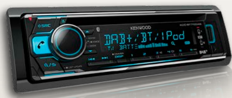
Radio DAB+/CD/MP3 mit USB und Bluetooth