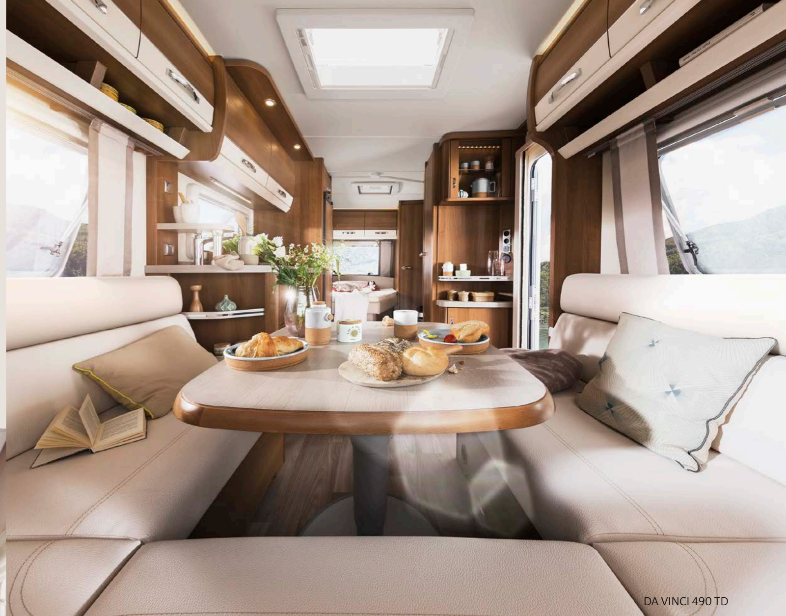
DA VINCI 490 TD

MEHR Erholung: Das TABBERT Komfort-Schlafsystem mit Watergel-Auflagen wirkt entlastend und kühlend zugleich.