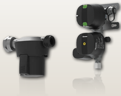
Truma DuoControl CS inkl. Gasfilter